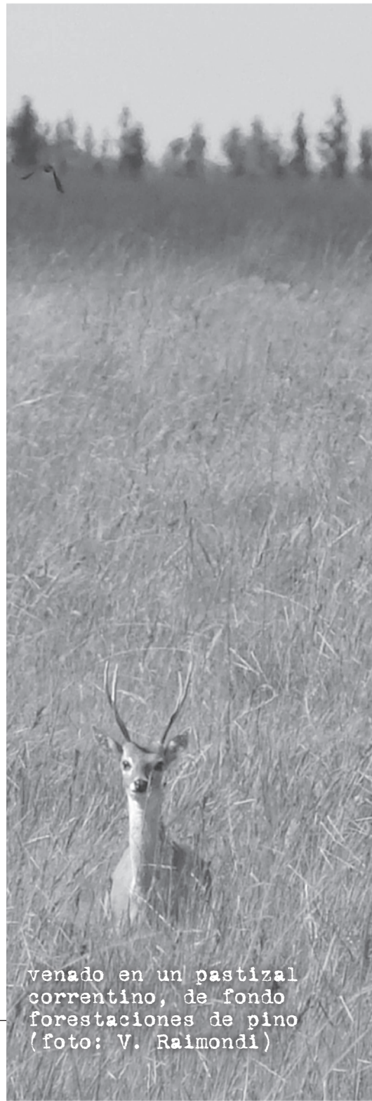
venado en un pastizal correntino, de fondo forestaciones de pino

La oportunidad: conservación in situ y restauración ecológica A partir del 2006 la fundación The Conservation Land Trust (CLT a partir de ahora) comenzó un proyecto de largo plazo destinado a conservar la población de venados correntinos. Este proyecto incluye un componente de seguimiento de la población con conteos poblacionales en 2006, 2007 y 2008 (ver mapa). La realización de conteos estandarizados mediante transectos lineales en estos dos últimos años está permitiendo tener un estimado mucho más preciso del número total de venados presentes en la región, el cual parece superar los 500 ejemplares (Alicia Delgado e Ignacio Jiménez, datos sin publicar). Esta cifra apunta a una población de venados claramente mayor que la estimada por los investigadores citados previamente. Sin embargo, dicha diferencia debe ser entendida como resultado del uso de diferentes metodologías de obtención y análisis