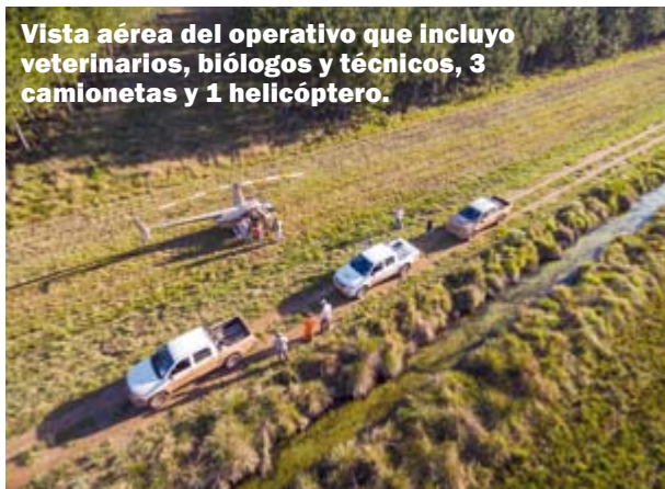
Vista aérea del operativo que incluyó veterinarios, biólogos y técnicos, 3 camionetas y 1 helicóptero.